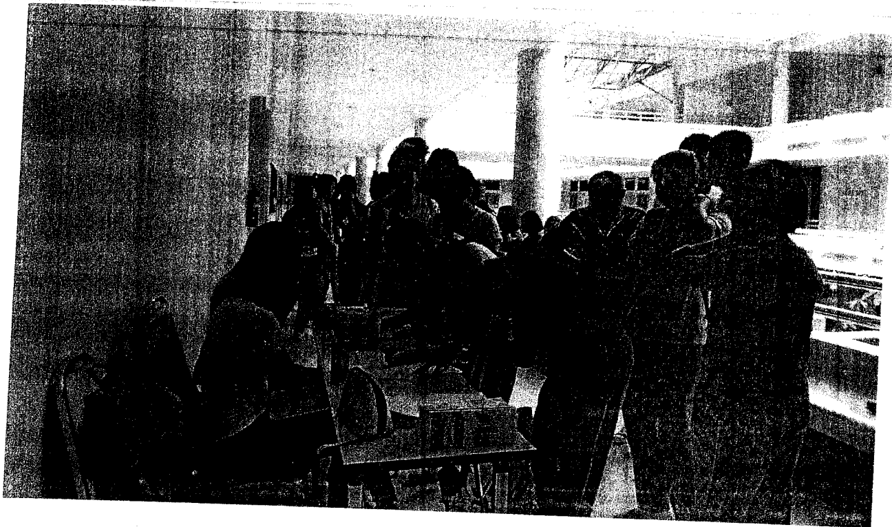
ภาพประกอบการจัดโครงการอนุรักษ์พันธุกรรมพืชอันเนื่องมาจากพระราชดำริฯ ณ วันที่ ๖ กรกฎาคม พ.ศ. ๒๕๕๖