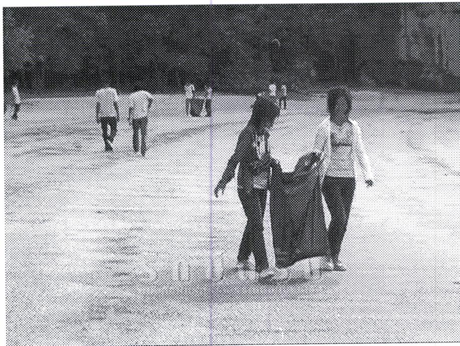
นักศึกษาเก็บขยะบริเวณหาดราชมงคลและหาดวิภาห์