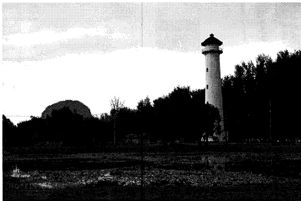
จุดถ่ายรูปสำหรับผู้มาเยือน (Land Marks)