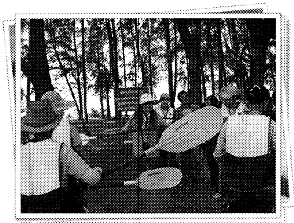
จัดอบรมการพายเรือแคนู