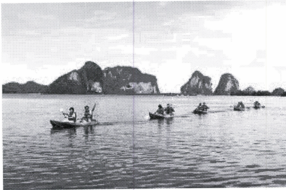
ฝึกทักษะการพายเรือแคนูบริเวณหาดราชมงคล