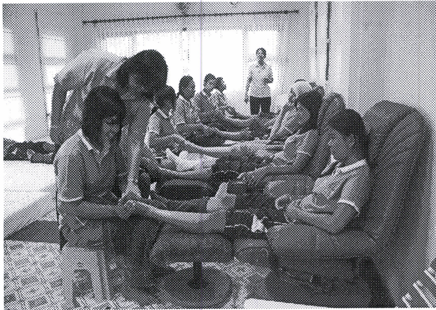
ฝึกทักษะการนวดสปา

ภาพแสดงการฝึกงานภายในศูนย์ฝึกของนักศึกษาสาขาการโรงแรมและการท่องเที่ยว