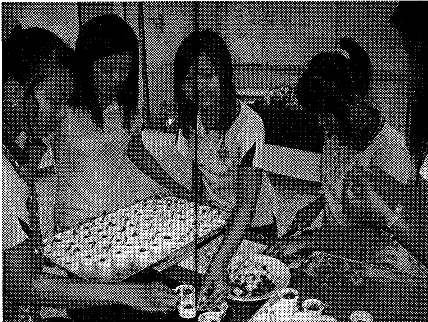
ฝึกทักษะการทำขนม