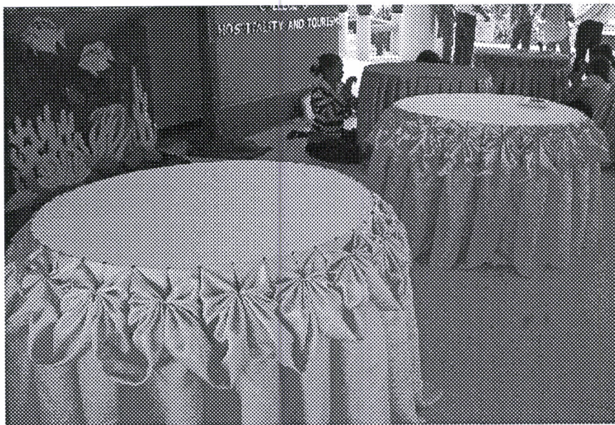
ฝึกการจับผ้าสเกิร์ตบุโต๊ะ ซึ่งใช้สำหรับการจัดสถานที่ต่างๆ