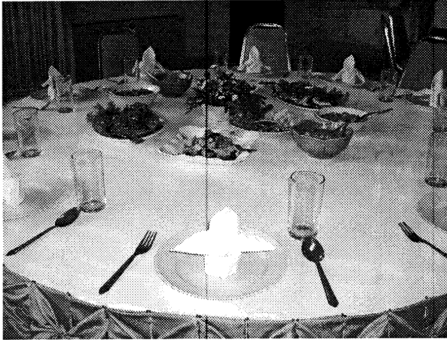
ฝึกทักษะการจัดโต๊ะอาหาร