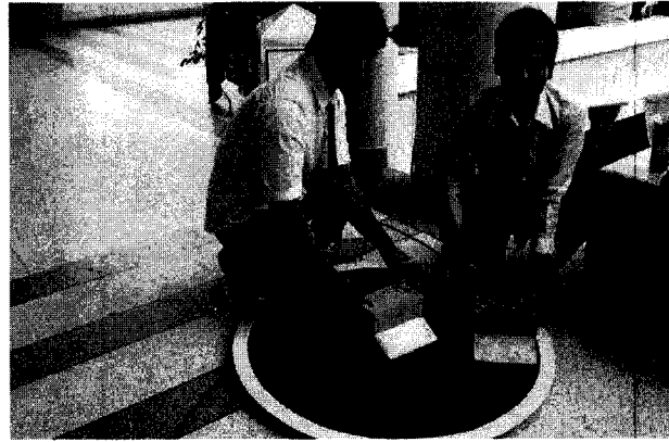
ผลิตภัณฑ์ การแปรรูปอาหาร และการแข่งขันหุ่นยนต์