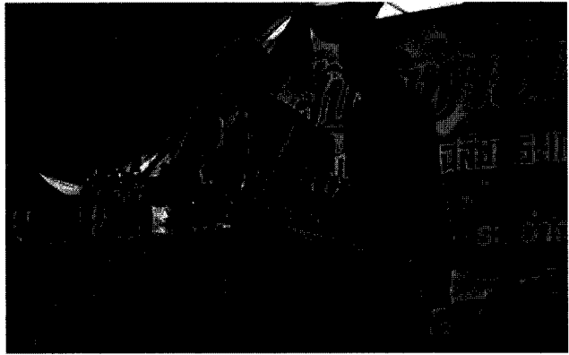
ความสามารถของนักศึกษา การผสมเครื่องดื่มประเภทลีลา