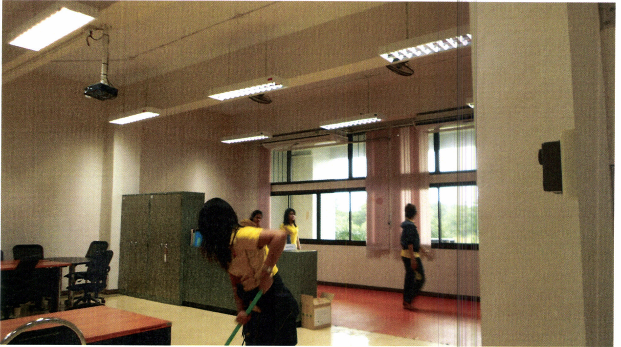
ภาพถ่ายการทำกิจกรรม ๕๘ วิทยาลัยการโรงแรมและการท่องเที่ยว